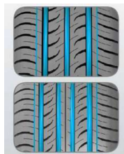
幅が215以上は4本センターグループ

3本の幅広センターグループと2本の浅溝が排水性を向上し、スリップを防止。シリカコンパウンド配合によりウェット性能向上。